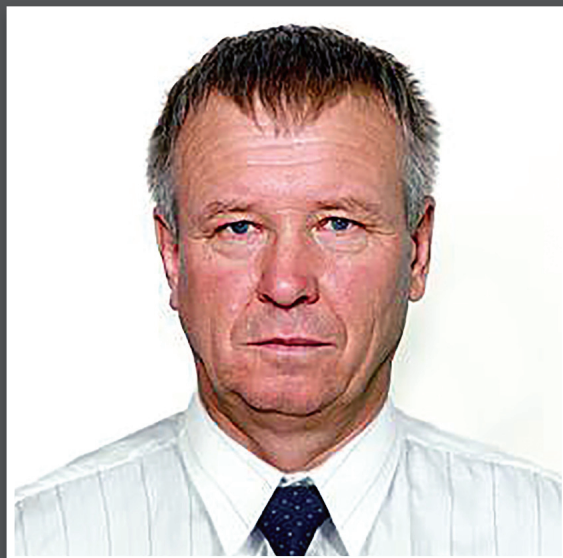
Народжений 12.12.1957р. Місцевий громадський активіст, Організатор житла та забезпечення базових потреб більш ніж 1000 ВПО

Викрадений групою із двох озброєних чоловіків, одягнених у камуфляж, за кермом машини із символікою ДНР