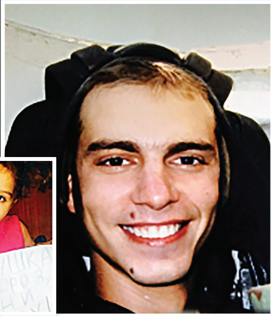
Військовий, народжений 21.04.1990р.