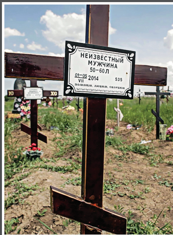
Напис на хресті: «Невідомий чоловік»

Після того, як бойовики втекли, в місті знайшли 3 масові захоронення. В них були поховані 14, 38 та 26 трупів із слідами тортур. Тільки 50% тіл вдалось ідентифікувати через аналіз ДНК. Усіх інших перепоховали як «невідомих під номером».