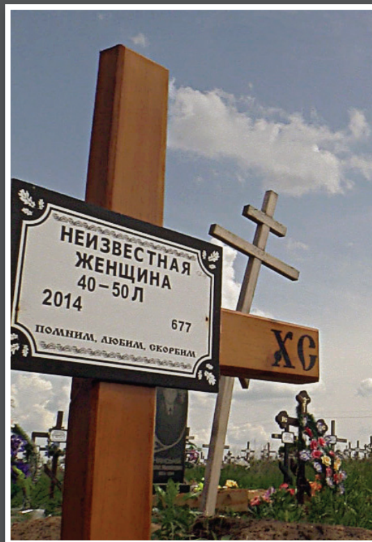
Напис на хресті: «Невідома жінка»