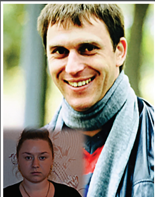
Військовий, народжений 13.07.1985р.