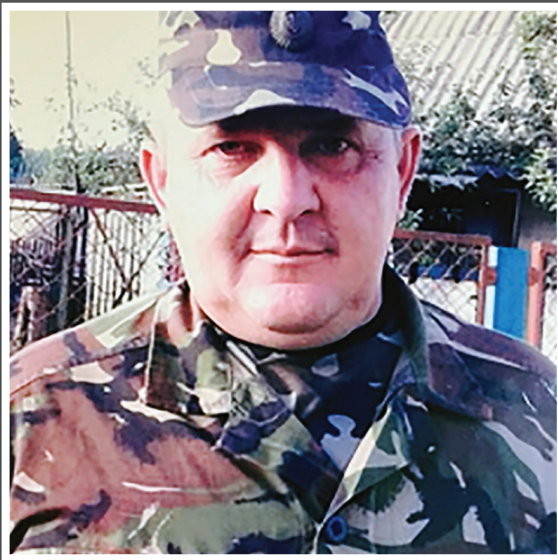
Військовий, народжений 08.08.1974р.

Інші матеріали, що були представлені «Центром Громадянських Свобод» та Євромайдан-SOS на засіданні квітневої Парламентської Асамблеї Ради Європи 2015 року, під час презентації доповіді: «Безвісті зниклі особи протягом конфлікту в Україні» 41