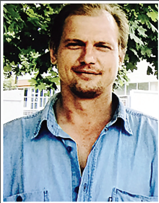
Військовий, народжений 12.12.1972р.