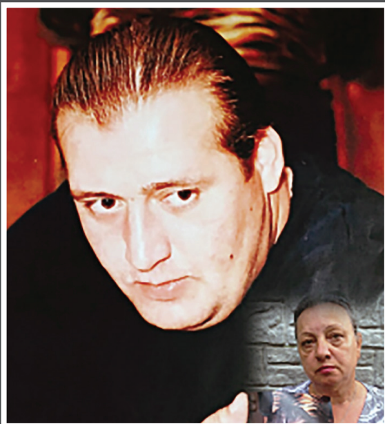
Цивільний, народжений 19.03.1976р.