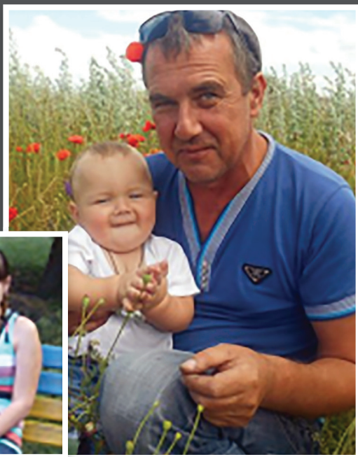
Цивільний, народжений 24.12.1958р.