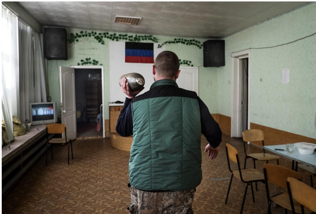
Повстанець переносить снаряд по будівлю Церкви Христової в Донецьку. Березень 2015.

Інша група проросійських бійців зайняла церковне приміщення в листопаді 2014, і, станом на березень 2015 року будівля досі використовується як військовий табір. Від часу окупації церковної будівлі близько 100 членів спільноти зустрічаються таємно на молитви в різних місцях, розкиданих по всьому Донецьку. Коли Крижановського запитали чи він боїться, що протизаконні підрозділи міліції ДНР заборонять збиратися на богослужіння по домах, він відповів: "Ми не боїмося, адже й перших християн переслідували. Але вони не боялися проповідувати Ісуса Христа". 44