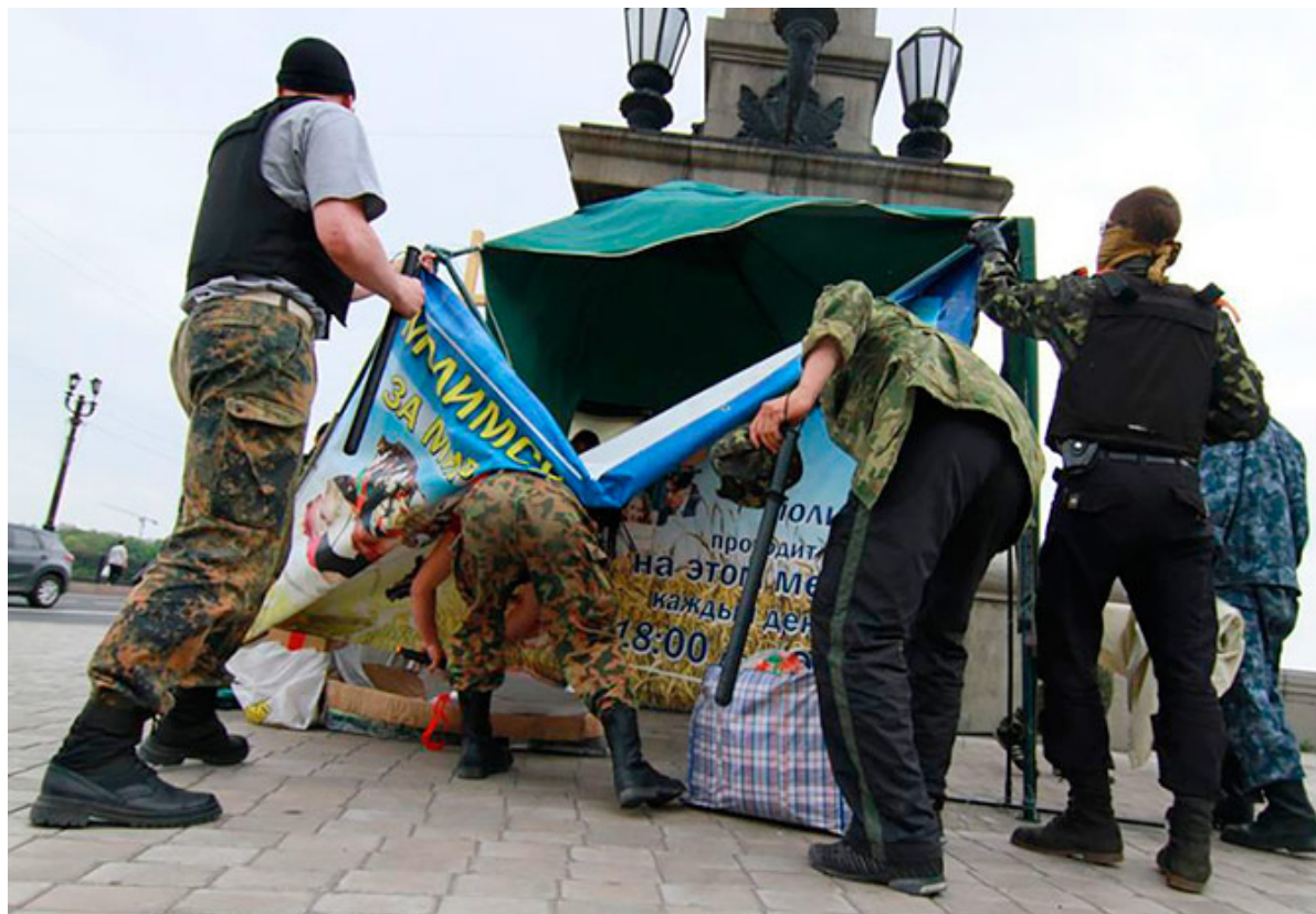
Проросійські бойовики руйнують намет молитовного марафону на площі Конституції в Донецьку, травень 2014

Станом на березень 2015, молитви проводяться секретно, у домах невеликої кількості пасторів та парафіян, що залишилися в окупованому Донецьку.