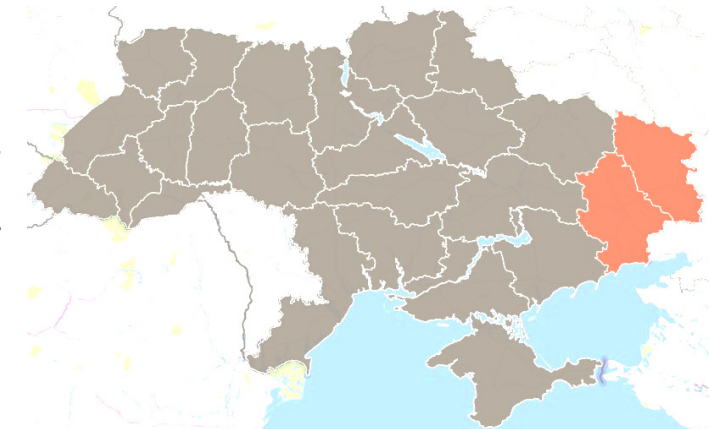
На карте Украины выделены Донецкая и Луганская области

В июле 2018 года волонтерами HelpAge была проведена оценка потребностей на подконтрольных правительству территориях Донецкой и Луганской областей. Структурированные интервью с бенефициарами проводились с использованием многомерной формы оценки уязвимости (VAF) В результате опроса было охвачено 4,595 пожилых людей (которые были предварительно отобраны на основе различных степеней уязвимости); проведена оценка их дохода, потребности в защите, здравоохранении и т. д.