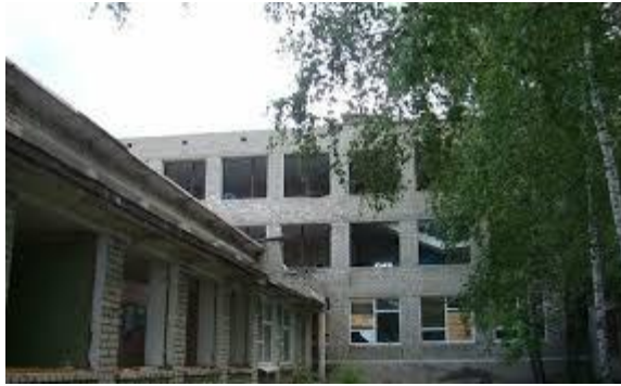
Фото зруйнованої школи в м. Зоринську

Щодо другого випадку – у вересні 2016 року на блокпосту біля м. Комсомольського (т.зв. «ДНР») НЗФ було затримано громадянина К. та його товариша за безпідставною підозрою щодо їх перебування у стані алкогольного сп'яніння.