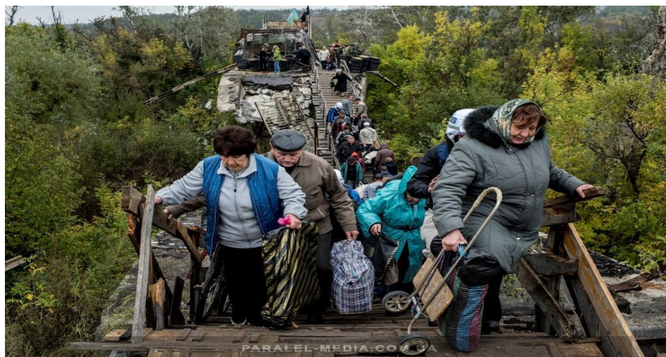
КПВВ «Станиця Луганська»

Наразі існує поширена практика звернень до суду з метою надання дозволу на перетин лінії зіткнення сторін за відсутності одного з батьків. Судова процедура потребує від заявника часу та грошових витрат, що становить певну перешкоду у реалізації права на свободу пересування.