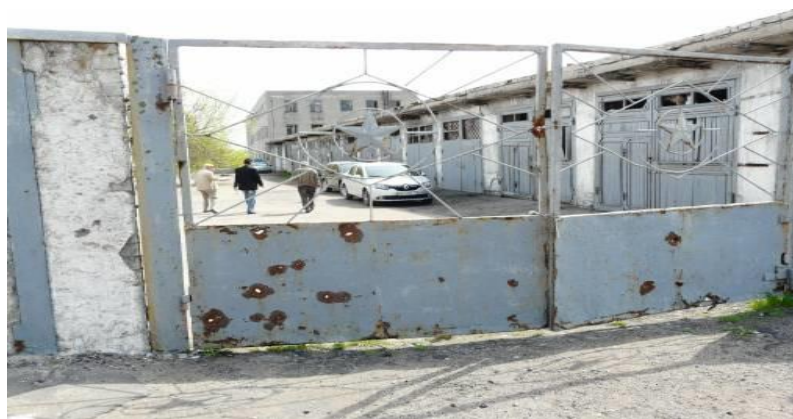
Виправна колонія №32, м. Макіївка Донецької області

Ув'язнені стикаються з проблемою отримання належних документів та українського паспорту після звільнення . Документ про звільнення, виданий установами т. зв. «ЛНР» та «ДНР» є неналежним з точки зору українського законодавства, створює проблеми при перетині лінії розмежування та подальшого перебування на підконтрольній уряду України території.