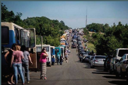
Очереди при пересечении блокпостов.

6.5. Проезд к населенным пунктам «серой зоны» часто сопровождается бесосновательными требованиями военных предъявить пропуск, который выдается для пересечения линии соприкосновения, или справку внутренне перемещенного лица. Также на некоторых блокпостах проезд возможен только по списку, утвержденному местной администрацией.