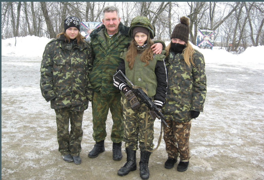
Военно-патриотический клуб «Амазонки» находится в г. Горловка Донецкой области и является структурным подразделением объединенной тактической группы «Рекрут» (Москва, РФ). Девушек учат обращению с оружием – разборке и сборке автомата, тактической подготовке, выживанию в лесных и зимних условиях.

3.6. С началом вооруженного конфликта активизировались молодежные и юношеские военно-патриотические движения на подконтрольной и неподконтрольной правительству Украины территориях. Одной из форм деятельности таких движений является проведение военно-патриотических ла-