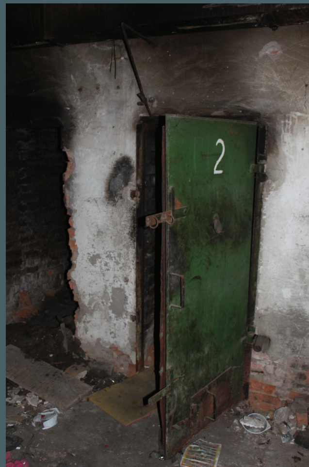
Подвальное помещение колбасного цеха, база 24-го батальона территориальной обороны «Айдар» Луганской области (Луганская область, Старобельский район, с. Половинкино)

1.9. Несмотря на серьезность проблем, с которыми сталкиваются или могут столкнуться лица, освобожденные из незаконных мест лишения свободы, сегодня отсутствует государственная программа медицинской и психологической помощи пострадавшим от насилия в местах несвободы. Так, из числа опрошенных организациями – членами Коалиции респондентов, которые находились в