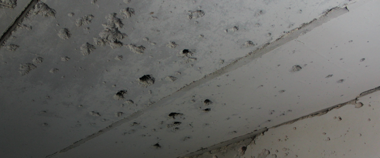
Авдеевская центральная городская больница (Донецкая область, г. Авдеевка)

вреждена крыша больницы, вокруг стекло...», – говорит сотрудница Станично-Луганской центральной районной больницы.