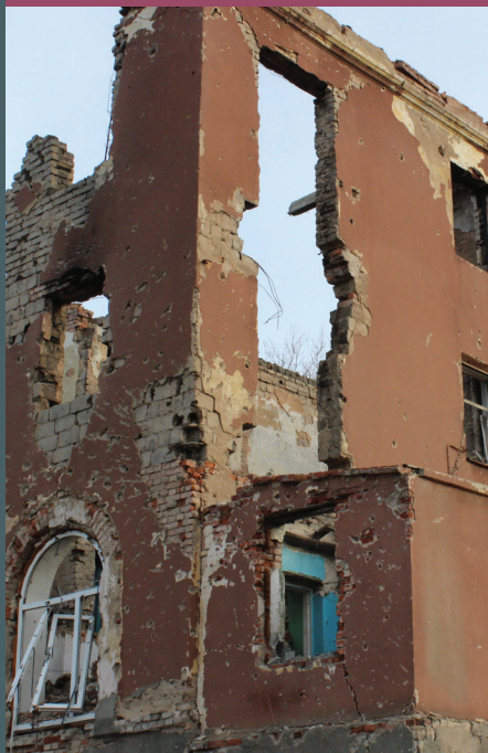
На фото: Областная психиатрическая больница г. Славянска (Донецкая область)