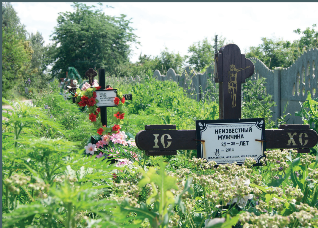
Могила неизвестного мужчины на кладбище (Донецкая область, г. Славянск)

4.6. Отдельно следует обратить внимание на ситуацию, сложившуюся в связи с пропажей без вести военнослужащих Вооруженных Сил Украины. По данным ОО «Мирный берег», по состоянию на начало марта 2017 г., 425 военнослужащих Вооруженных Сил