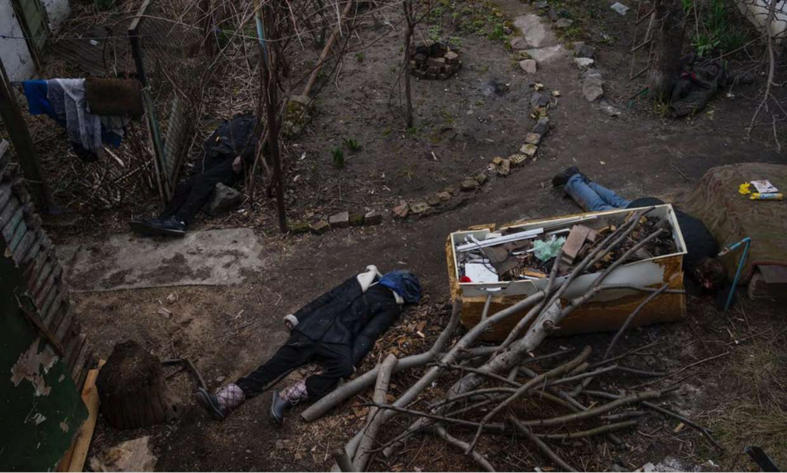
Буча, березень 2022 рік

Такі дії збройних сил РФ дають підстави стверджувати про наявність ознак використання голоду серед цивільного населення як методу ведення війни. Вочевидь, подібна критична гуманітарна ситуація за задумом російського військового командування мала б скластися й в решті українських населених пунктах, що перебували в осаді, зокрема в Чернігові та Сумах, що примусило б захисників скласти зброю. Водночас, збройні сили РФ були вимушені відступити з північних регіонів України.