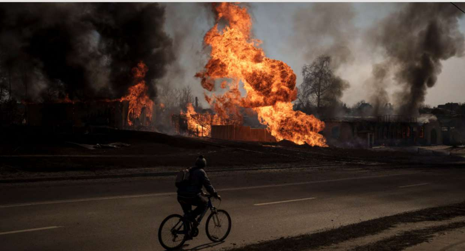
Харків, 25 березня 2022 рік

Поступово наростає та стає помітною загроза навколишньому природному середовищу: забруднення повітря, шкода екосистемам, водним ресурсам і т. д.