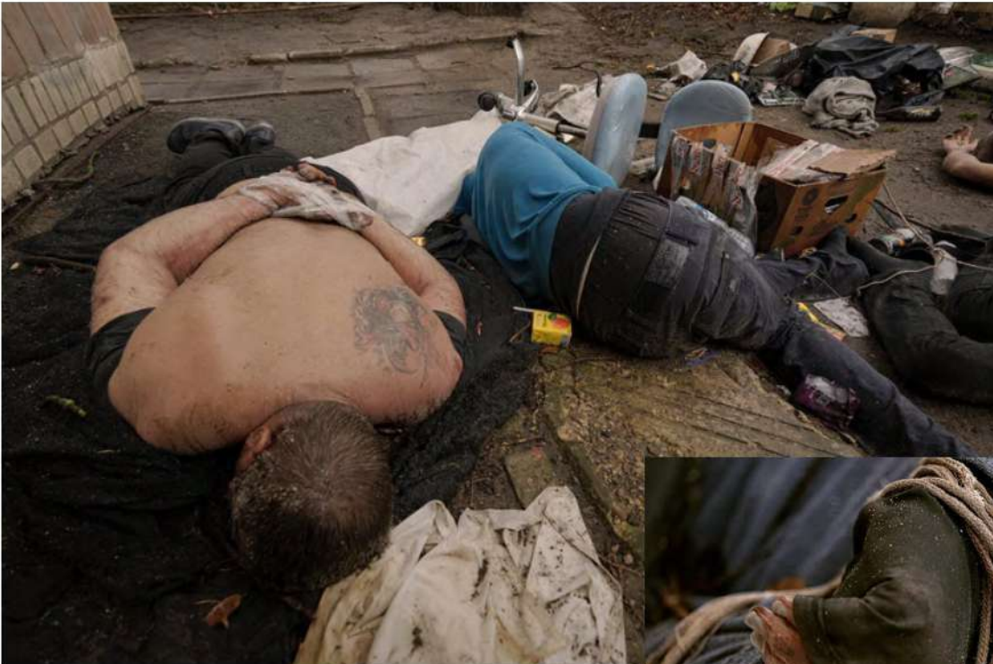
Буча, березень 2022 рік

З'являється все більше свідчень про пряму або опосередковану участь в затриманнях цивільного населення колишніх українських посадовців або правоохоронців.