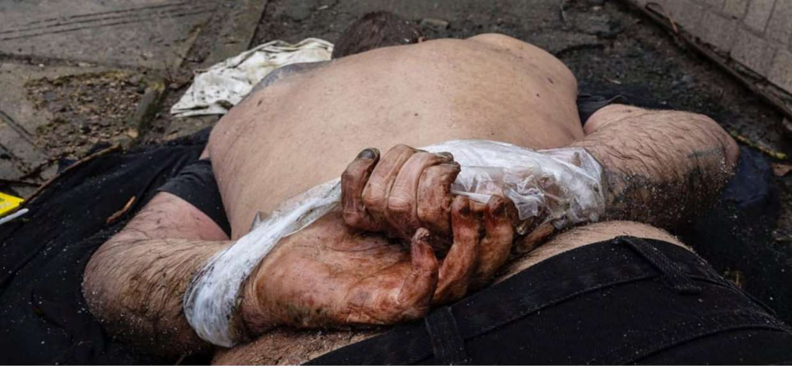
Буча, березень 2022 рік