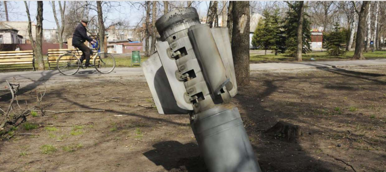
Краматорськ, 8 квітня 2022 рік

Збройні сили РФ продовжували ігнорувати норми МГП та в порушення принципу розрізнення здійснювали умисні напади як на цивільних осіб, так і на цивільні об'єкти. Кількість нападів невибіркового характеру залишалася надзвичайно високою. В багатьох випадках можна стверджувати про недотримання збройними силами РФ принципу пропорційності при нападах. Суть останнього полягає у тому, що забороняються напади, від яких можна очікувати спричинення випадкової загибелі цивільного населення або поранення цивільних осіб, пошкодження цивільних об'єктів або поєднання таких наслідків, які були б надмірними порівняно з очікуваною конкретною та безпосередньою військовою перевагою, що мали б одержати.