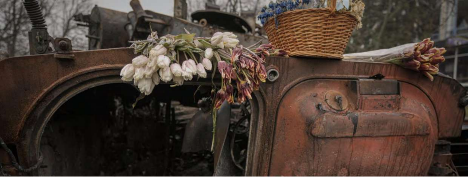
Фото: Vadym Ghirda 4 квітня 2022 рік

Крім офіційних осіб, про випадки сексуального насильства повідомляли також приватні особи.