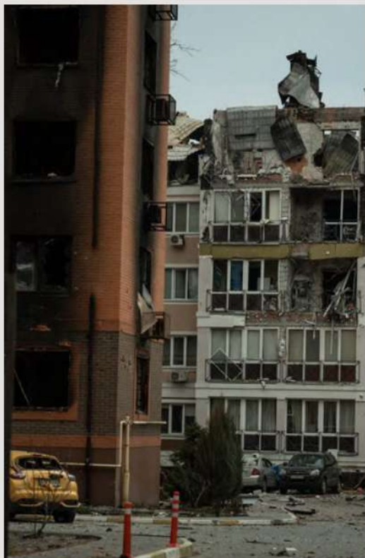
Ірпінь, 30 березня 2022 рік

Пресслужба Херсонської міськради: «Херсон оточений окупантами. Ми не можемо виїхати. До нас не можуть заїхати. У місті закінчується борошно для випікання хліба, проблеми з ліками та паливом. Зупинилися підприємства, багато хто втратив роботу».