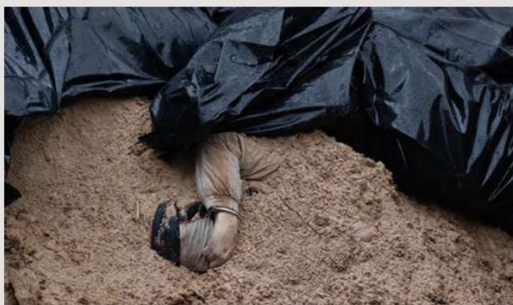
Буча, 4 квітня 2022 рік

Президент України В. Зеленський під час виступу з промовою в парламенті Ірландії зазначив : «Вони послідовно знищують місця зберігання палива, розподільчі центри продуктів, знищують навіть звичайну аграрну техніку і мінують поля».