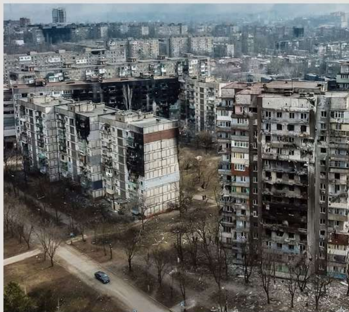
Маріуполь, 31 березня

Місто й надалі обороняється, але більша його частина контролюється переважаючими силами збройних сил РФ. З тих районів міста, які перейшли під контроль росіян, військові вивозять цивільне населення для подальшого переміщення до окупованого Донецька (інших окупованих міст Донеччини та Луганщини) та на територію РФ. Повідомляється про створення росіянами т. зв. «фільтраційних таборів», метою яких ймовірно є перевірка жителів Маріуполя на причетність до оборони міста (до участі в бойових діях) та затримання проукраїнські налаштованих людей.