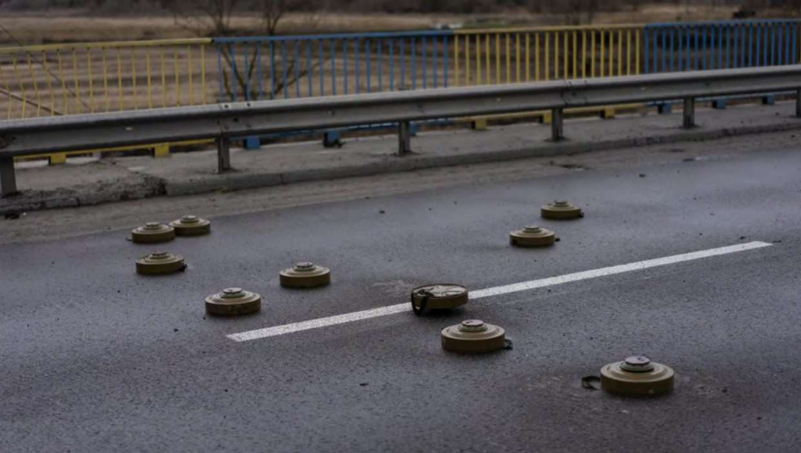
Буча, 2 квітня