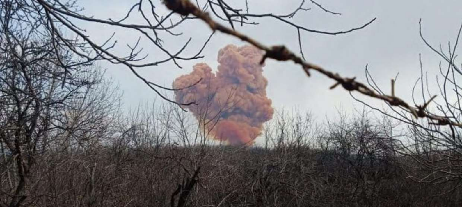
Рубіжне, 5 квітня 2022 рік