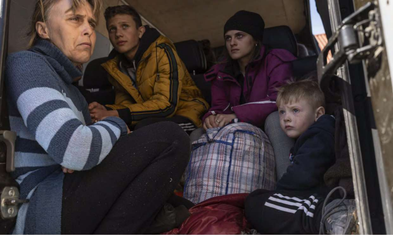
Буча, 7 квітня 2022 рік