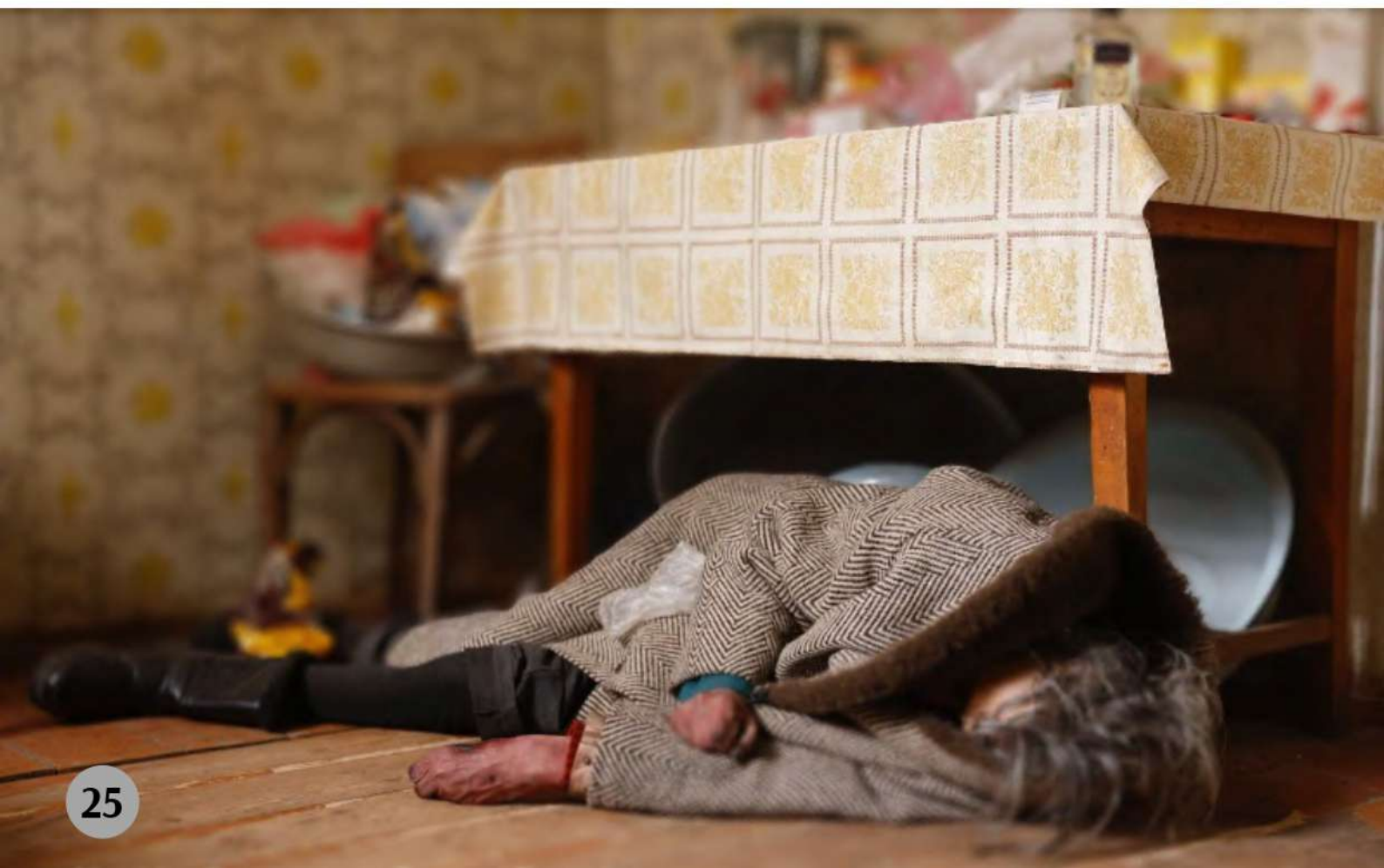
Буча, березень 2022 рік

Протягом минулих двох тижнів продовжувалася блокада російськими військами м. Маріуполя. Станом на початок облоги в місті могло перебувати близько 300-400 тис. цивільного населення. Росіяни продовжують вибірково випускали частину населення власним транспортом на виїзд з міста (в напрямку м. Бердянська), але значна кількість людей як і раніше не можуть виїхати, оскільки або не мають власного транспорту (в багатьох людей він пошкоджений/знищений чи відсутнє пальне), або лишаються заблокованими в районах міста, де точаться активні бойові дії. Українські та міжнародні гуманітарні вантажі та автобуси для організованої евакуації людей як і раніше російськими військовими до міста не пропускаються. В місті з початку березня (в окремих районах – з 24 лютого) відсутні централізоване водопостачання, включно з питною водою, світло, опалення, не можливо придбати продукти харчування. Ситуація в місті критична. Продовжує надходити інформація про голод серед цивільного населення.