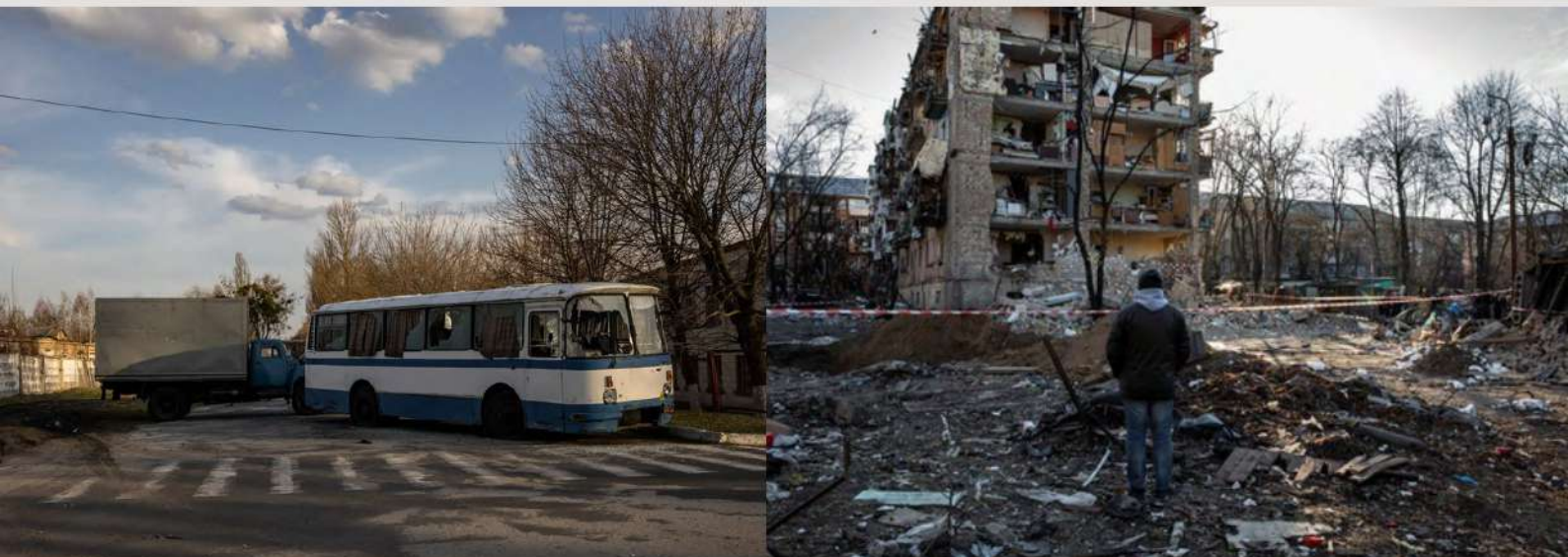
Київ, 28 березня

Видання «Беларускі Гаюн» оприлюднило тригодинний відеозапис з камери спостереження у відділенні служби доставки «СДЭК» в білоруському Мозирі (неподалік кордону з Україною). На відео можна побачити, як російські військові оформлюють пересилання побутових речей. Пізніше були встановлені імена військових (16 осіб), місце призначення та наповнення відправлень (одяг, рибальське приладдя, інструменти, музичне приладдя тощо).