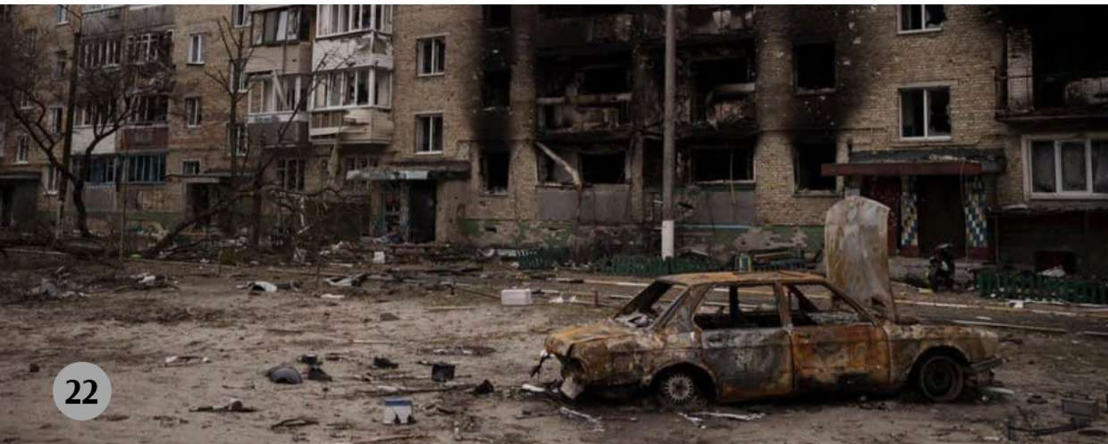
Харків, березень 2022 рік

На сторінці приватної компанії «Агротек» в Фейсбук з'явилося повідомлення про те, що російські військові викрали сільськогосподарську техніку John Deere в Мелітополі. Мова йде про два нових флагманських комбайна, трактор та сівалку, загальною вартістю 1 млн. євро. Майно було викрадено з виставкового майданчика компанії. Цікаво, що завдяки позиційним системам, що встановлені на обладнанні, фахівці компанії зафіксували, що техніка наразі знаходиться на території господарства у селищі Закан-Юрт Чеченської республіки. 05 та 08 квітня компанія «Агротек» публікувала схожі повідомлення про розграбування майна компанії: комбайна, жатки, сівалок та ін. Судячи з усього, розграбування триватиме й надалі.