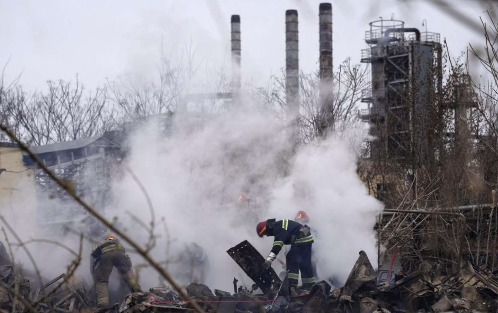
Одеса, 3 квітня 2022 рік