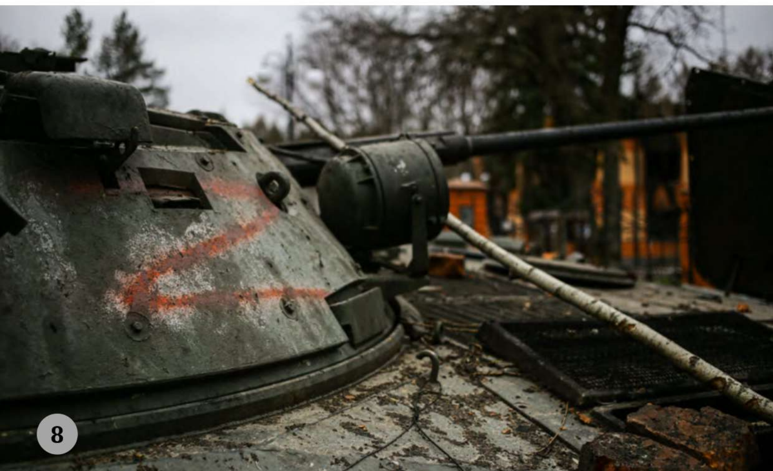
Тростянець, березень 2022 рік

Голова військової адміністрації Кривого Рогу Олександр Вілкул під час брифінгу повідомив , що на звільнених територіях Херсонської області вже стало відомо про згвалтували російськими військовими вагітної 16-річної дівчини та 78-річної жінки.