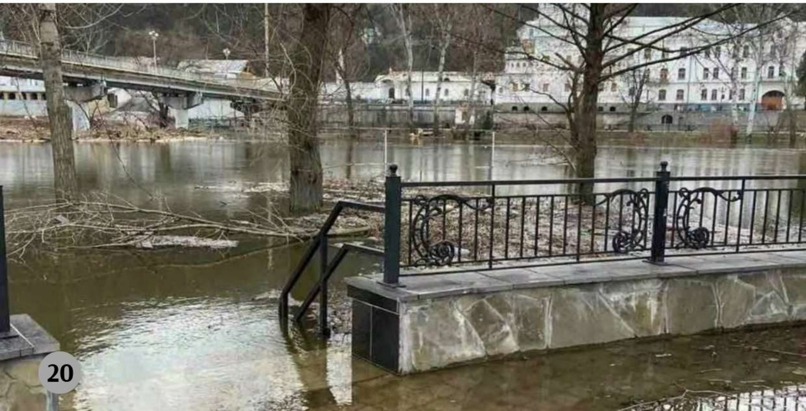
Святогірськ, 2 квітня 2022 рік

З'явилися повідомлення про руйнування внаслідок підриву дамби на Оскольському водосховищі (Харківська обл.). Потоки води хлинули у південному напрямку та підтопили населені пункти, зокрема, м. Святогірськ (Донецька обл.).