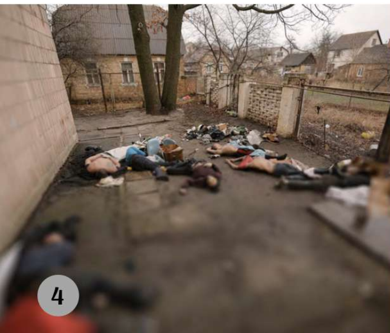
Буча, березень 2022 рік

Буча, березень 2022 рік